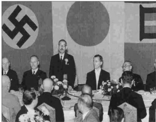
日独伊三国同盟 ドイツはナチスヒトラー政権 イタリアはムッソリーニファシスト政権

日本学術会議が推薦した6人の任命を菅首相が拒否した問題。日本学術会議への人事介入が大きな問題となっています。 テレビでは、論点反らしのコメントや日本学術会議のイメーჯダウンをはかるフェイク情報の拡散がおこなわれています。